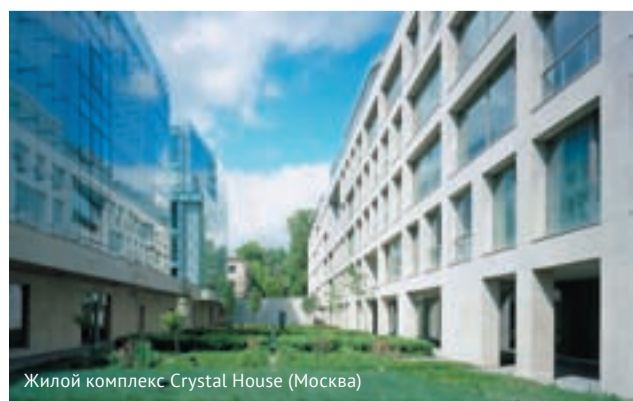
Жилой комплекс Crystal House (Москва)